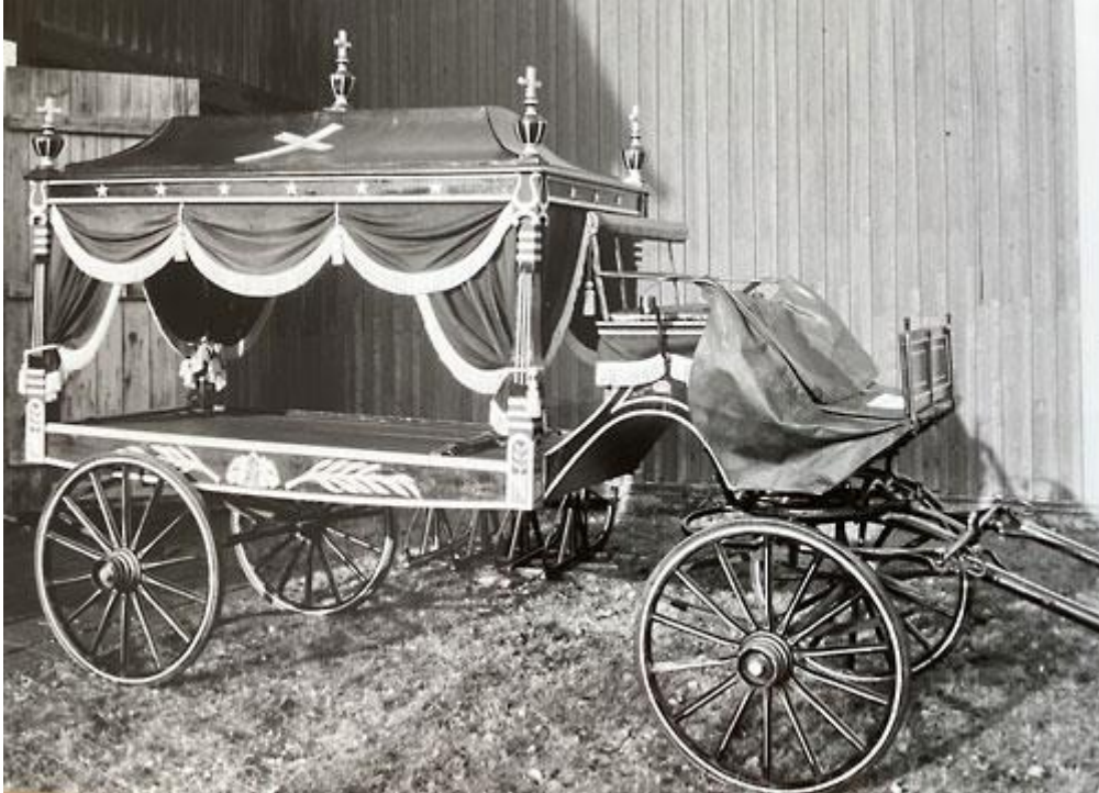
Ljustorps församlings begravningsvagn (katafalkvagn) för en draghäst. Under vagnen skymtar de medar som användes vintertid. Förvaras i Lögdö jordbruksmuseums förråd.

Begravningen inleds hemma hos den avlidne klockan 11 för samling kring den avlidne innan man lastar kistan på församlingens begravningsvagn och spänner för hästar och tågar till kyrkan.